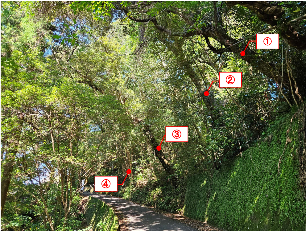
胸高直径50～60cm 高さ20m程度 4本